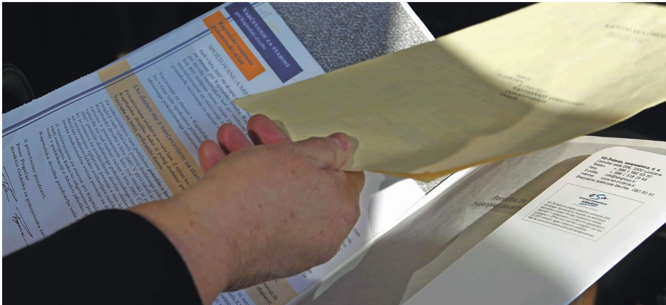
V 20 letih in več, za kolikor se NŽZ najpogosteje sklepajo, se lahko pokaže, da donosnost naložb ne bo takšna, kot se je zdelo pri sklepanju pogodbe.

Število skladov, med katerimi lahko pri tem izbirajo, se pri po-